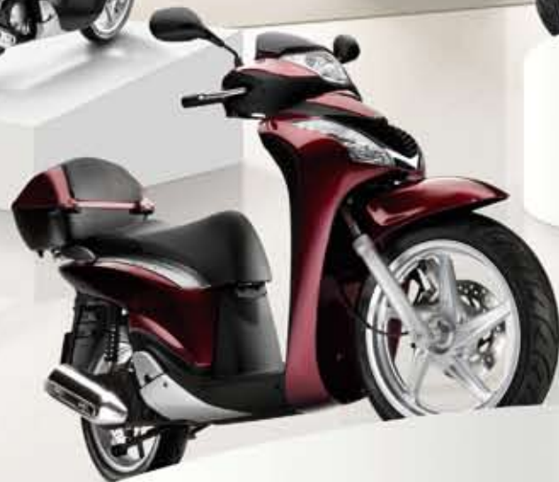
Velvet Red Metallic