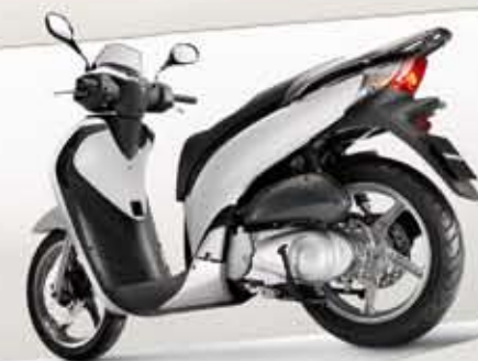
Pearl Cool White

Le tante colorazioni, originali ed accattivanti, ne riflettono il carattere vivace ed il grande appeal. Perfetta combinazione tra estetica e praticità, il nuovo SH125i / SH150i è destinato a sorprendere ancora una volta gli appassionati, entrando a pieno titolo nella leggendaria scuderia SH.