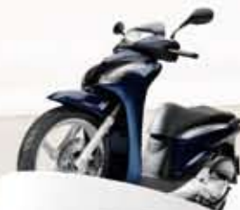
Pearl Montana Blue