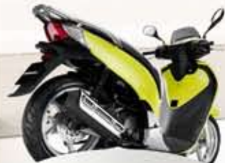
Pearl Acid Yellow