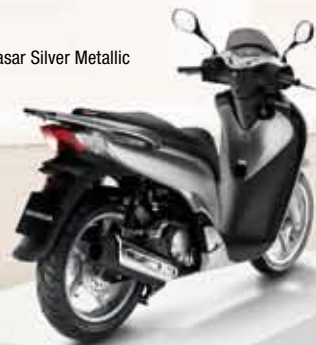
Quasar Silver Metallic

Bauletto originale Honda – 35L optional Il portapacchi consente il montaggio del bauletto senza bisogno di piastre aggiuntive.