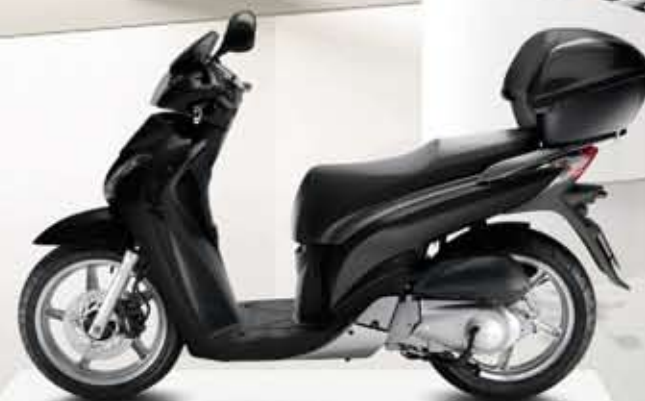
Pearl Night Star Black (Bauletto opzionale)